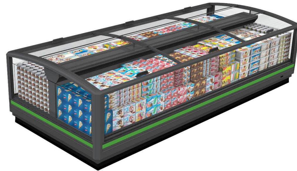
GranOntario N (Narrow)