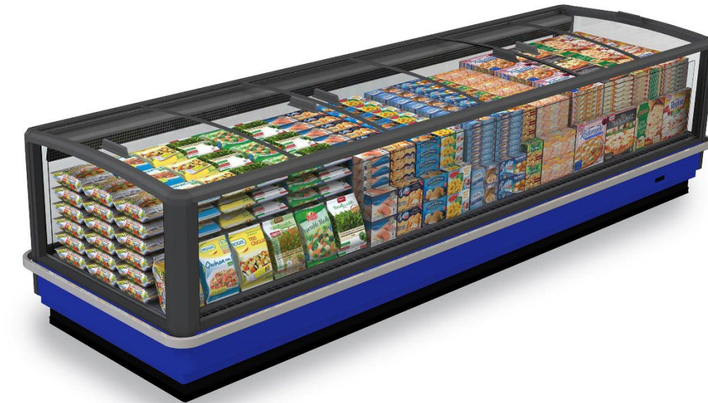
GranOntario C (Compact)