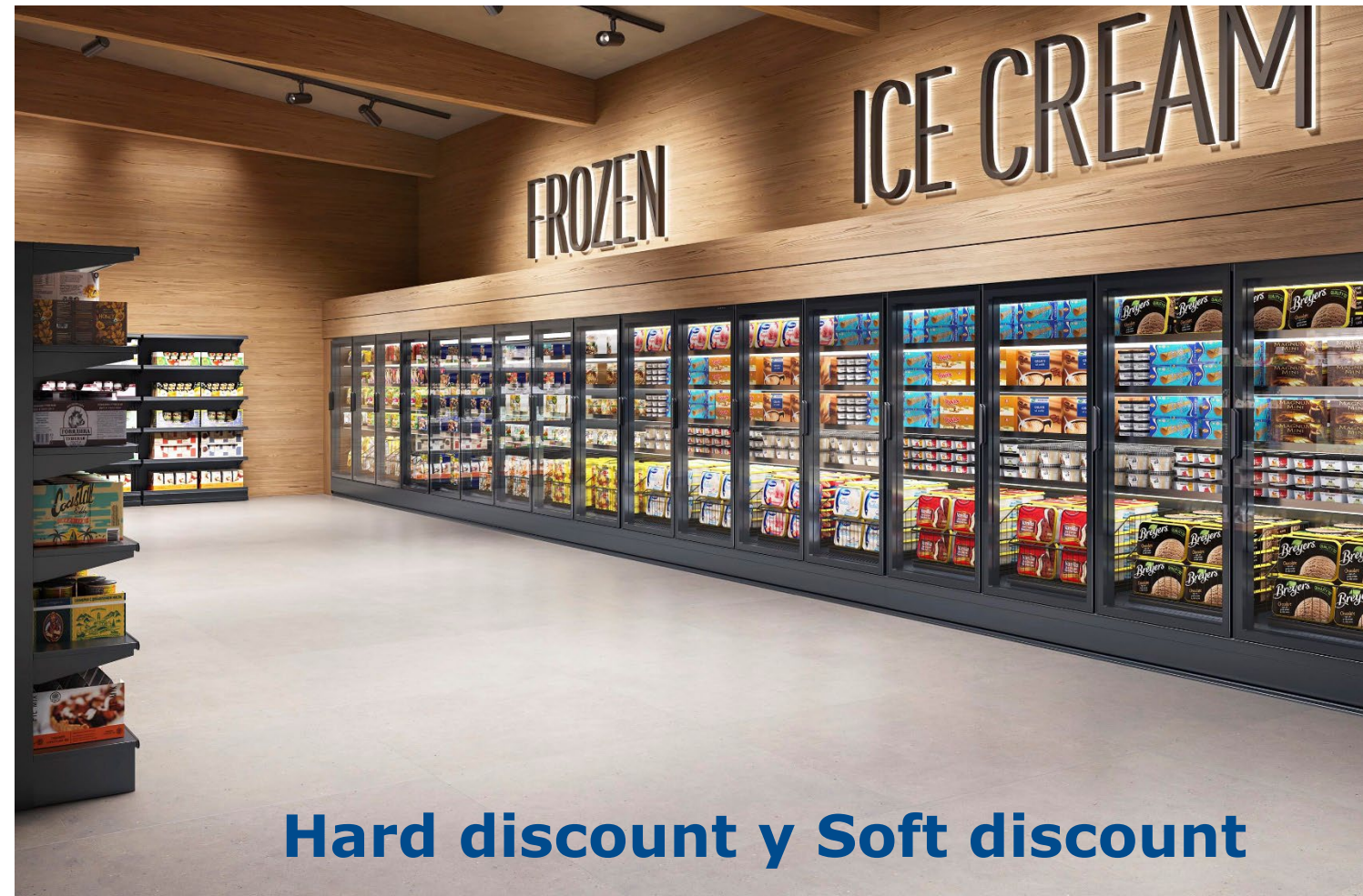
Hard discount y Soft discount

GranBering Integral Ultra se enfoca a todas las actividades minoristas