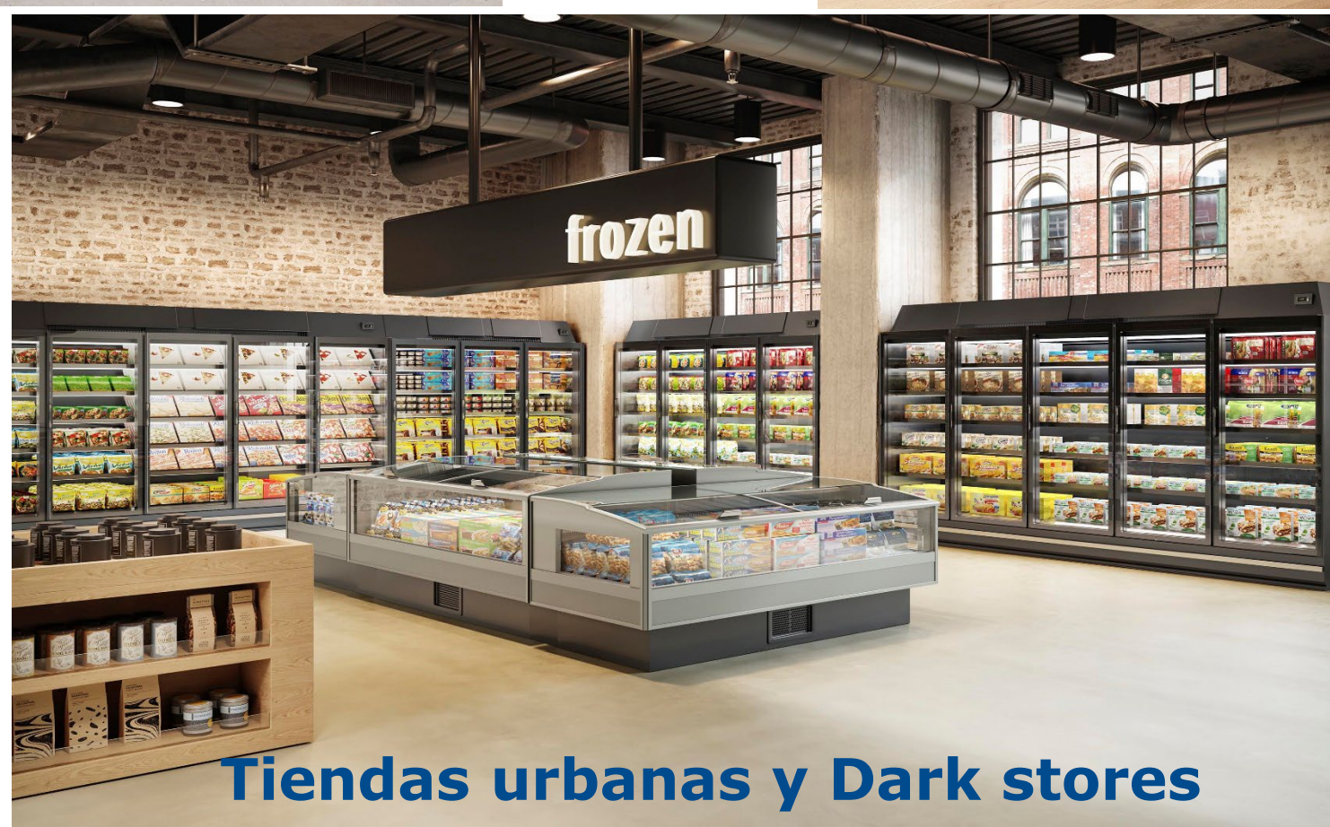
Tiendas urbanas y Dark stores