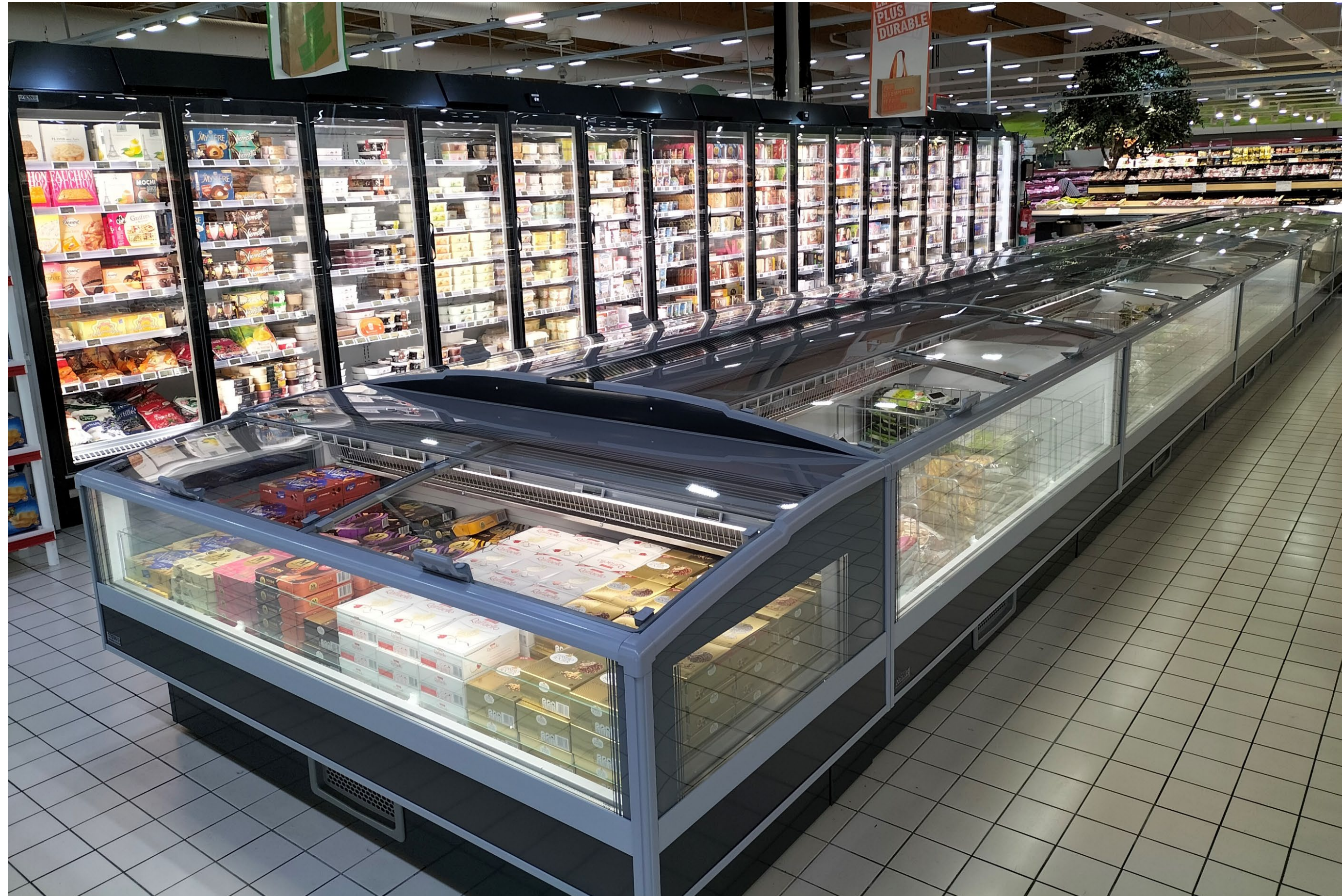
GranBering Intregal Ultra área de congelados plug-in completa junto con el congelador horizontal Beluga